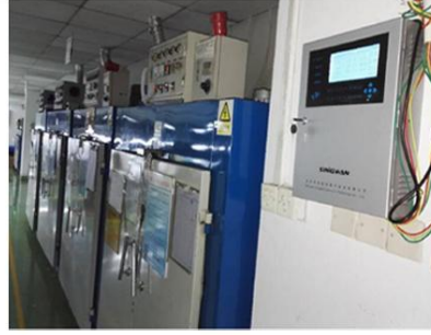
深圳某钟表厂安装实例

电话: 0755-85258900 传真: 0755-85258903 地址: 深圳市龙岗区龙岗大道万汇大厦908