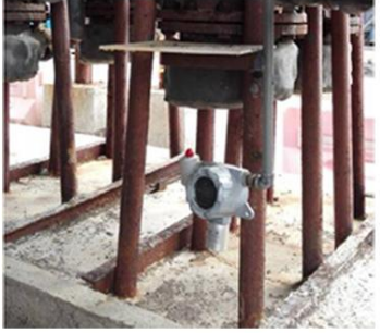
江西某化工厂安装实例