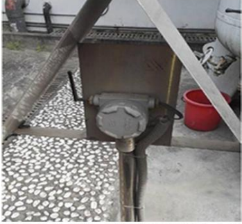
东莞华为生产基地-无线气体检测仪安装实例