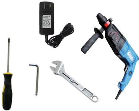
5. 准备工具：螺丝刀、扳手、冲击钻、电源适配器