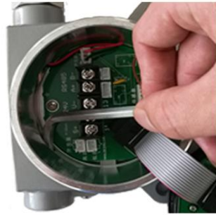
12. 轻轻地可以将里面的胶塞捅出来