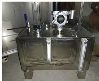
检测仪管道式安装实例