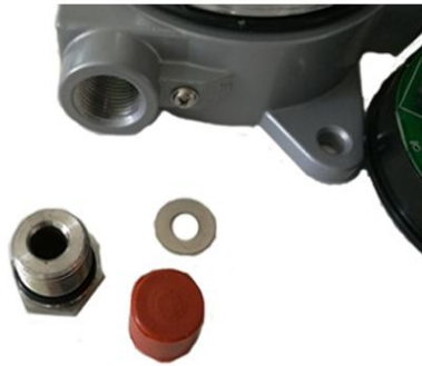
13. 穿线孔的配件螺帽、胶塞、铁圈