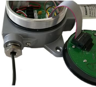
17. 将配件放入穿线孔，用扳手将螺帽拧紧