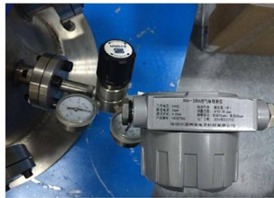
上海电力学院实验室安装实例