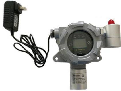
18. 将显示屏放回原位，拧紧防爆外壳