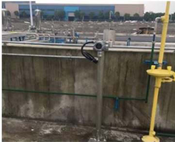
蓝星杭州水处理技术研究开发中心安装实例