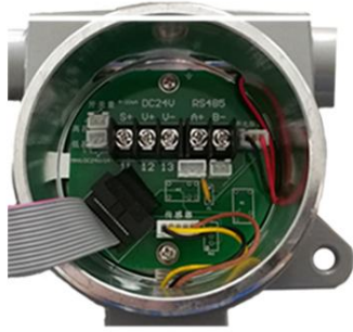
9. 可以看到检测仪内部构造