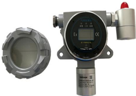
7. 检测仪开盖，屏幕内含操作按键，可设置检测仪相关报警点