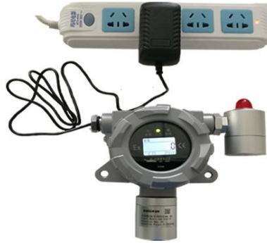
19. 将检测仪安装在指定位置，接上螺丝固定，接上电源，屏幕显示读数，检测仪已正常工作。