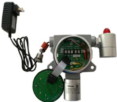
15. 依次将配件穿进穿线孔