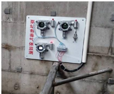
苏州某污水处理厂安装实例