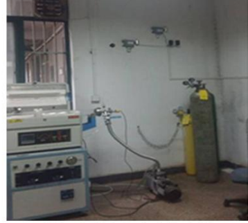
浙江大学实验室安装实例