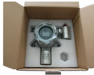
4. 产品开箱（以含显示、声光报警为例）