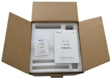
3. 产品开箱（内含产品合格证、使用说明书）