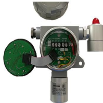
8. 轻轻拿下检测仪的显示屏，避免弄坏显示屏线路接口