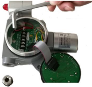
11. 用螺丝刀捅开穿线孔里的胶塞