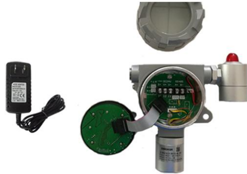
14. 准备将电源适配器的线穿过穿线孔