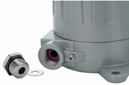
10. 拧开检测仪穿线孔